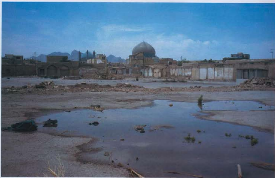
Dernière la mosquée du Cheikh- Lotfollah, Ispahan, Iran, mai.

“On voyait le bulbe léger des mosquées flotter sur la ville étendue. [...] Ispahan est devenue province, elle s'est rétrécie, et ses immenses et gracieux monuments séfévides flottent sur elle comme des vêtements devenus trop grands. Ils s'effritent aussi et se détériorent [...] C'est justement par cet abandon si humain au temps, qui est leur seule imperfection, qu'ils nous deviennent accessibles et nous touchent.”