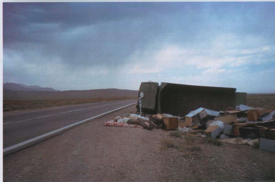
Sur la route de Bam, Iran, juin.

“NOUS COMMENÇONS À NOUS INQUIÉTER LORSQU'UN PETIT CAMION ENVOYÉ PAR LA FORTUNE S'ARRÊTA À NOTRE HAUTEUR...”